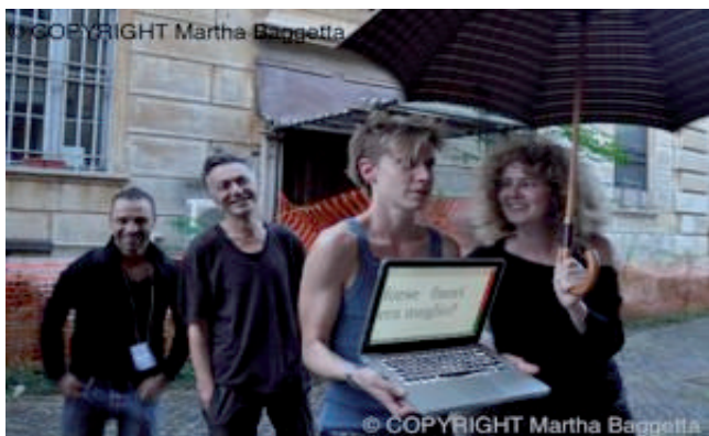
Where